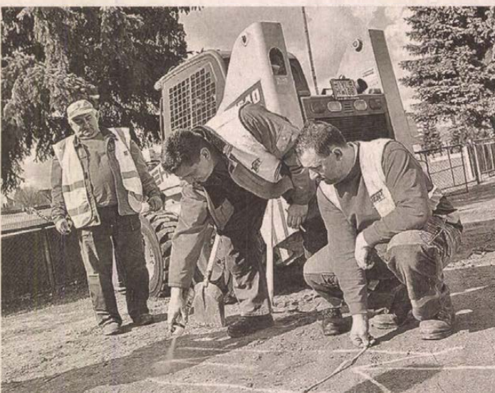
A nyomvonal-kijelölés megtörtént, de a befejezés ideje még nem ismert

Hat és fél kilométer kábelt mintegy 500 méteres szakaszon fektetnek le a Tömegközlekedés Energiaellátás Tervező és Kivitelező Zrt. munkatársai a Szentmarjay Stadionban. A budapesti cég alkalmazottai tegnap láttak munkához, hogy elvégezzék a létesítmény világításához szükséges további teendőket. Ismert, hogy tavaly november 26-án az új energia betáplálásához nélkülözhetetlen 400 kV-os trafóállomás alapján ásásával kezdtek az Elektromos Műszaki Szolgáltató Kft. szakemberei, ám azóta nem történt előrelépés a fejlesztésben. Hétfőn a TEN-T Zrt. alkalmazottai nekiláttak a