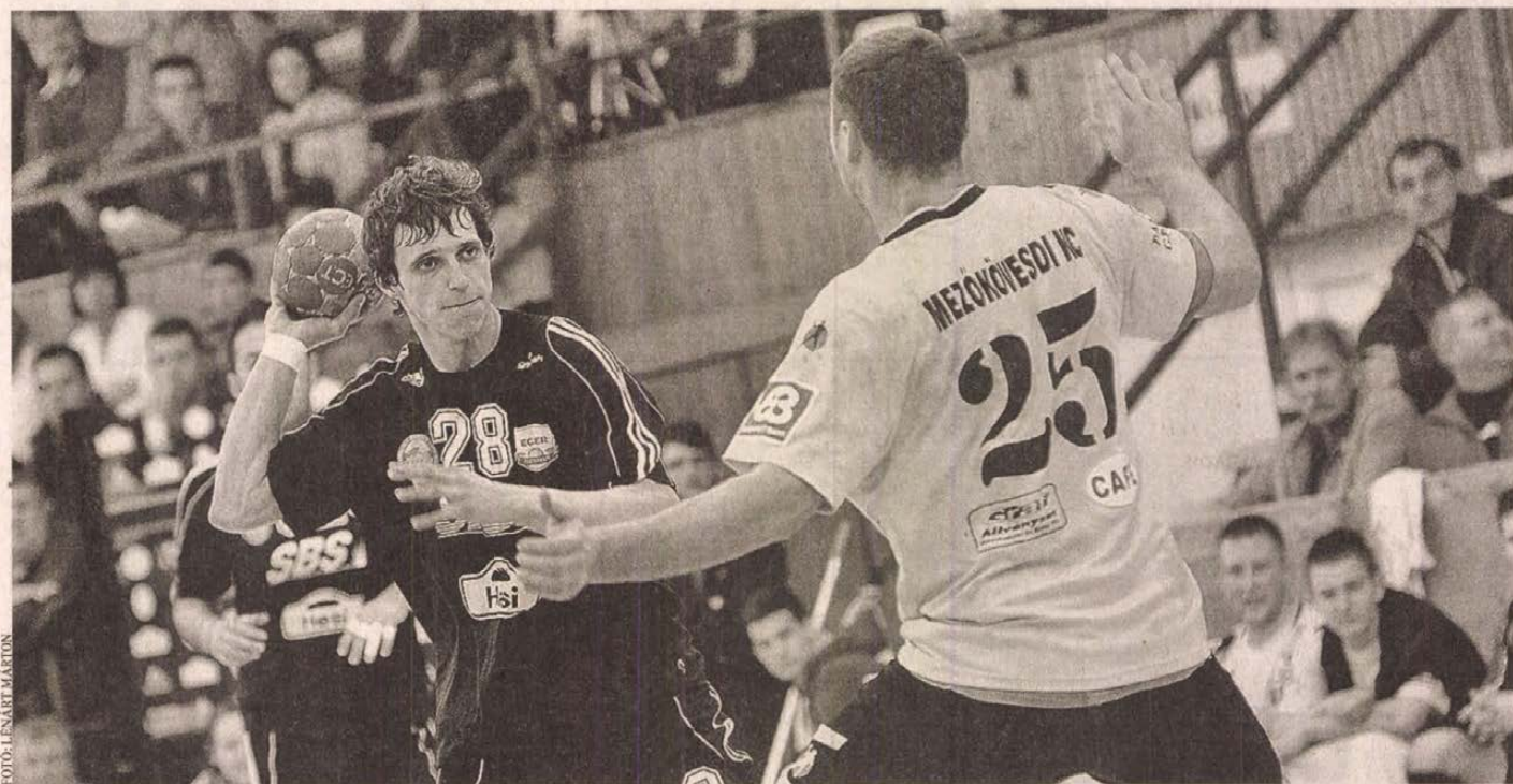
Az egri Nyeste Balázsék (szemből) a második félidőben már nem tudtak megújulni a szomszédvári presztízsmecsen

NB I/B Újabb rangadót veszített az SBS Eger-Eszterházy SzSE