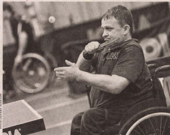
A mérkőzések a Hotel Eger & Parkban és a körcsarnokban zajlanak majd