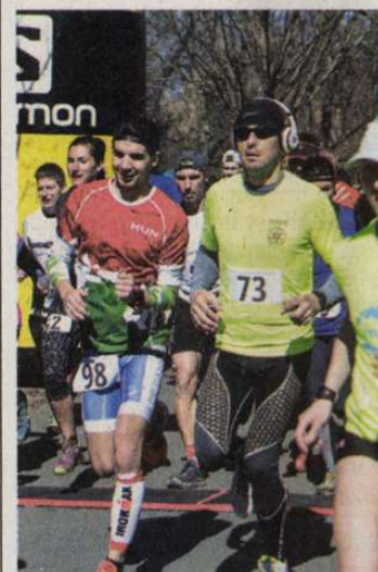
Vasárnapra már jobb időjárást jósolnak

Az Érsekkerti Körök elnevezésű megméretés startja 11.10, ez esetben az Érsekkertben kijelölt pályán zajlik a hat kilométeres verseny. B. Cs.