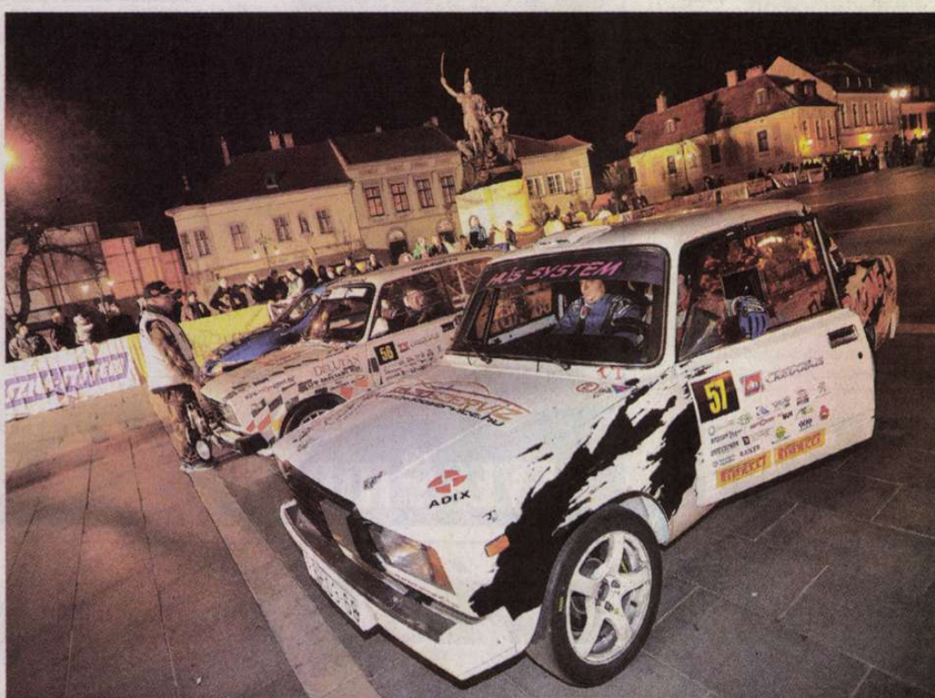
Az ünnepélyes rajtceremóniához ezúttal is remek díszletet nyújt a Dobó tér

Drávucz 20-25 kilométeres tesztet tervez a viadal előtt, hogy ismét hozzászokjon az